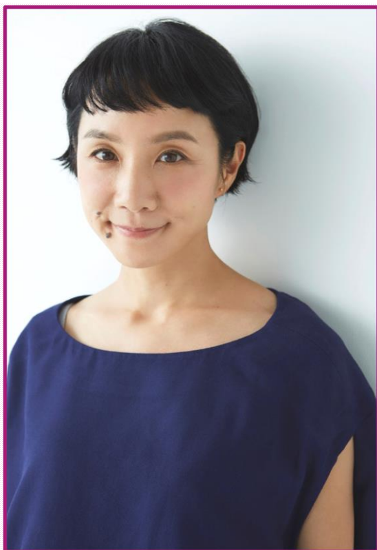
講師 モデル はな 先生

三十三間堂「文化講座」係 TEL: 075(561)0467 〒605-8691 京都市東山郵便局私書箱3号